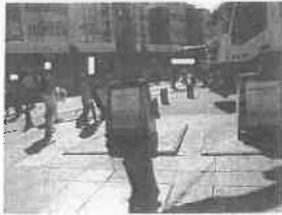
【イタリア・ゴミ収集地下ピット】