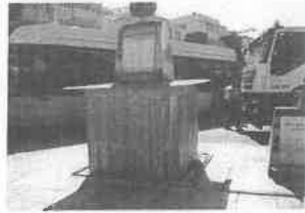
【イタリア・地下ピットが上がっている】