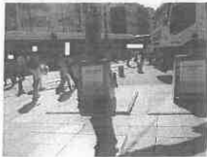
【イタリア・ゴミ収集地下ビット】