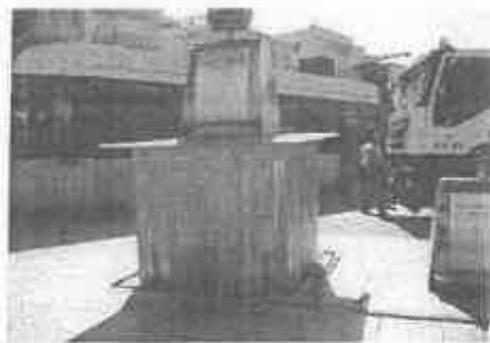
【イタリア・地下ビットが上がっている】