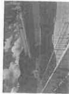
【閉園の朝日ヶ丘幼稚園】