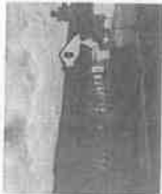
【園園予定の新浜保育園】