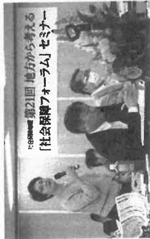
第21回 地方から考える「社会保障フォーラム」セミナーの様子

また、今後の状況に応じて、延期または全面的にオンラインセミナーとしての開催も想定しております。今後の連絡に際しましては、HPに告知するとともに、電話・Eメール等で個別にご連絡を申し上げます。日程の変更によりご出席が難しくなられた場合はFAX、メール等でご連絡をいただければ幸いです。