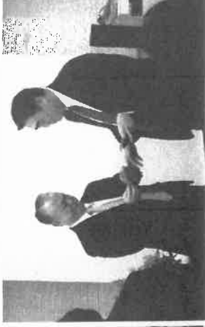
セミナー毎日好評連載中!