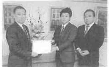
平成31年度予算要望書提出