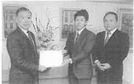
平成31年度予算要望書提出