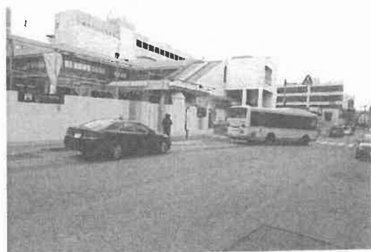
JR芦屋駅前の様子 2020・12撮影

再開発に関しては、身の丈にあったプランとして駅前道路拡幅によってシンプルに交通課題の解決を図ることを目的とした修正予算案を提出し、賛成多数でいったん可決しましたが、市長が「拒否権」である「再議」を請求。その結果、修正案も否決されました。その結果、現段階において、再開発計画を進める主要な予算案は否決され、計画は振り出しに戻った形です。今後は、持続可能な芦屋市として生き残るために何が必要なのかを考えながら、「アフターコロナに向けたまちづくり」を念頭に課題解決に取り組んでいきたいと考えています。