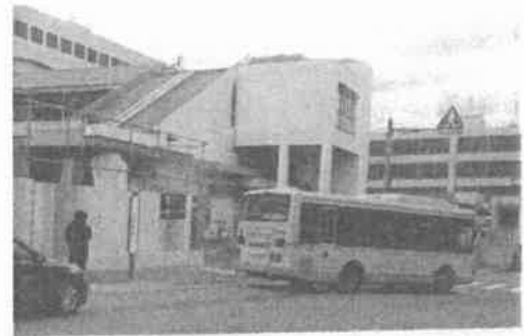
JR 芦屋駅南 2020・12・15 撮影

現行の再開発事業案を「にぎわい創出や経済の起爆剤」と位置付けながらも、具体策や効果に関して市は全く示せていません。