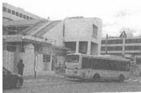
JR 芦屋駅南 2020・12・15 撮影

現行の再開発事業案を「にぎわい創出や経済の起爆剤」と位置付けながらも、具体策や効果に関して市は全く示せていません。