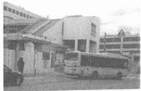
JR 芦屋駅南 2020.12.15 撮影

現行の再開発事業案を「にぎわい創出や経済の起爆剤」と位置付けながらも、具体策や効果に関して市は全く示せていません。