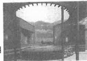
芦屋市霊園のイメージ図