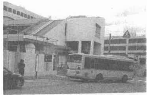
JR 芦屋駅南 2020・12・15 撮影

現行の再開発事業案を「にぎわい創出や経済の起爆剤」と位置付けながらも、具体策や効果に関して市は全く示せていません。