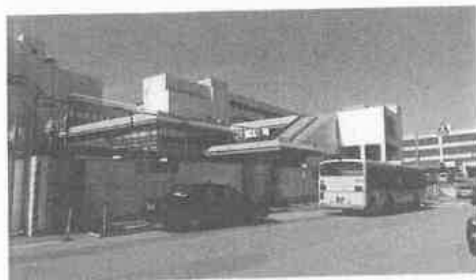
JR 芦屋駅南のようす(2020.6撮影)