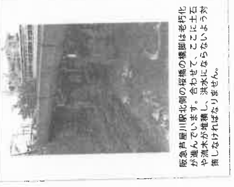
阪急芦屋川駅北側の桜橋の橋脚は老朽化が進んでいます。合わせて、ここに土石流や流木が堆積し、洪水にならないよう対策しなければなりません。

以前から指摘されていた重大な課題ですので、早急に見直されるよう強く求めます。また、高齢者以外にも自力で避難することが困難な方々への具体的な対策が不可欠です。