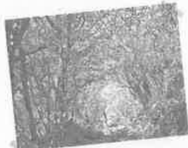
山花のコバノミツバツツジのトンネルが続く城山登山道 (撮影：ひらの)