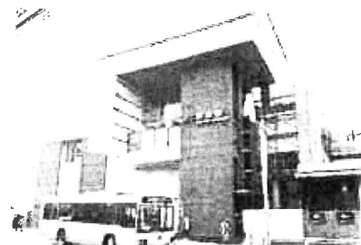
3月26日より JR芦屋駅南口の供用が始まりました

なお、事業の中身は、1年前に事業費を大幅に縮減してから特に変わったとは言えず、時間と人件費等を浪費しただけと言えます。さらに、地権者や市民を待たせてきたことは、重く受け止めるべきです。(かわしま)