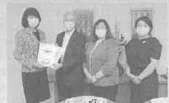
伊藤市長に予算要求書を渡す議員団

の申し入れに対する率直な意見も出されるなど、懇談しました。(ひらの) ※予算要求書をご入用の方は、各職員までご連絡下さい。