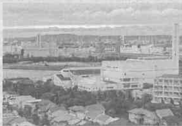
芦屋浜から見た2つの焼却施設

E-mail / kawashima.ayumi.san.1453@gmail.com