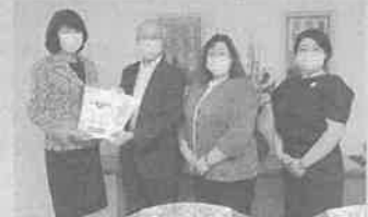
伊藤市長に予算要求書を渡す議員団

の申し入れに対する率直な意見も出されるなど、懇談しました。(ひらの) ※予算要求書をご入用の方は、各議員までご連絡下さい。