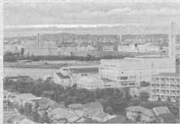
芦屋浜から見た2つの焼却施設

自治体を越えての「広域連携」は、国が推奨している大きな流れです。当初、焼却施設を一緒にすることで、20年間で両市合せて130億円の効果があるなどと言われていましたが、あくまでも試算であること、2つの市の人口規模が違ふ(1:1.5)こと