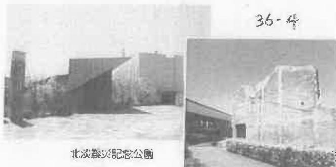
北淡震災記念公園