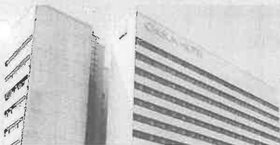
チサンホテル神戸