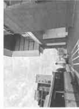
【JR 芦屋駅南側エレベーター入口】

JR 芦屋駅の駅舎外観、エスカレーターやエレベーター駅舎内などの工事は着々と進む！