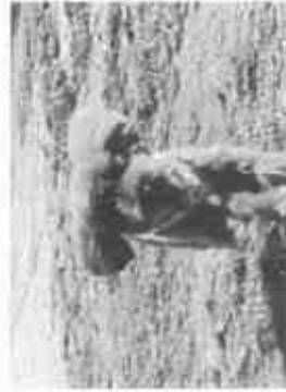
【ドッグランで走るワンちゃん】