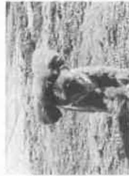
【ドッグランで走るワンちゃん】