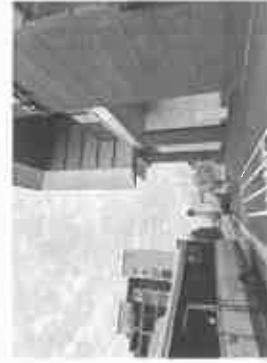
【JR 芦屋駅南側エレベーター入口】

JR 芦屋駅の駅舎外観、エスカレーターやエレベーター駅舎内などの工事は着々と進む！