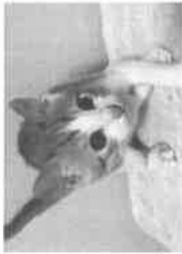
【保護猫たち、譲渡会前の一コマ】

提案② このような猫の問題を解決するには地域猫の活動を組織化して、公園などではなくシエルト施設(空き家活用など)で管理すれば双方が成り立ち方もいけません。