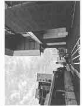
【JR 芦屋駅南再開発工レレベーター入口】

JR 芦屋駅の駅舎外観、エスカレーターやエレベーター駅舎内などの工事は着々と進む