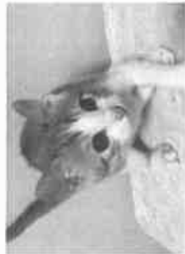
【保護猫たち、譲渡会前の一コマ】

提案②このような猫の問題を解決するには地域猫の活動を組織化して、公園などではなくシエルト施設(空き家活用など)で管理すれば双方が成り立ち方もありません。