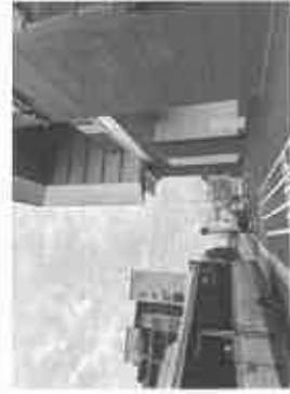
【JR 芦屋駅駅舎南側エレベーター入口】

JR 芦屋駅の駅舎外観、エスカレーターやエレベーター駅舎内などの工事は着々と進む』