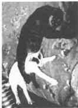
【保護猫たち、譲渡会前の一コマ】

このような猫たち問題を解決するには地域猫の活動を組織化して、公園などでなくシエルト施設(空き家活用など)管理すれば双方が成り立つかもしれません。