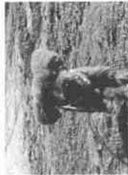
【ドッグランで走るワンちゃん】