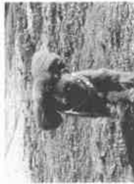
【ドッグランで走るワンちゃん】