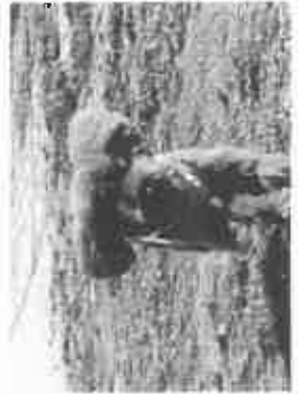
【ドッグランで走るワンちゃん】