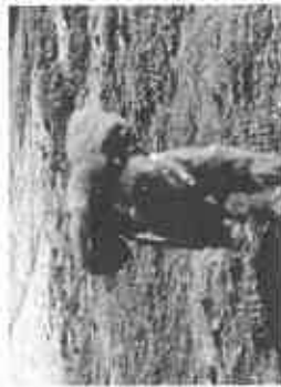
【ドッグランで走るワンちゃん】

芦屋ストリートピアノ構想 提議者 さすが芦屋だと言われる街かどピアノ設置を求めました