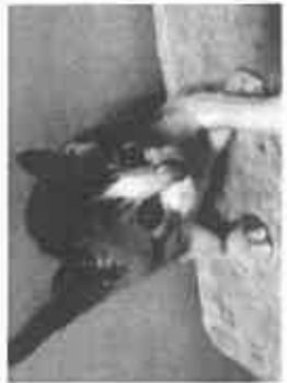
【保護猫たち、譲渡会前の一コマ】

Trap (トラップ)：捕獲すること、 Neuter (ニュートン)：不妊手術のこと、 Return (リターン)：猫を元の場所に戻す活動！ 基本は地域猫を増やさない活動で、いずれ猫はなくなると管理方法、動物愛護の精神に基づいた活動です。しかし、餌やりだけであるとは放置している人は問題ですすから組織化できないかを考えて欲しい。