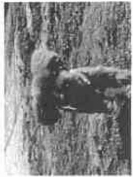
【ドッグランで走るワンちゃん】