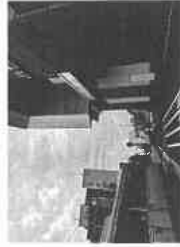
【JR 芦屋駅南開発エレベーター入口】

JR 芦屋駅の駅舎外観、エスカレーターやエレベーター駅舎内などの工事は着々と進む