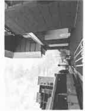
【JR 芦屋駅南側エレベーター入口】

JR 芦屋駅の駅舎外観、エスカレーターやエレベーター—駅舎内などの工事は着々と進む！