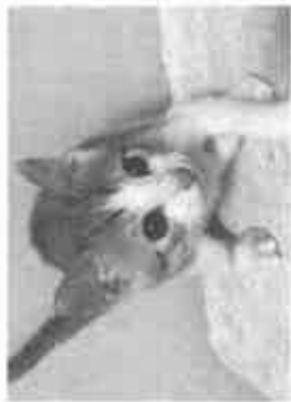
【保護猫たち、譲渡会前の一コマ】

提案②このような猫の問題を解決するには地域猫の活動を組織化して、公園などではなくシエルトア施設(空き家活用など)で管理すれば双方が成り立つかもしれません。