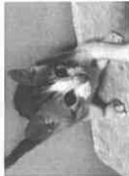
【保護猫たち、譲渡会前の一コマ】

提案②このような猫たち問題を解決するには地域猫の活動を組織化して、公園などではなくシェルター施設(空き家活用など)で管理すれば双方が成り立つかもしれません。