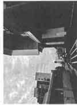
【JR 芦屋駅南側エレベーター入口】

JR 芦屋駅の駅舎外観、エスカレーターやエレベーター駅舎内などの工事は着々と進む