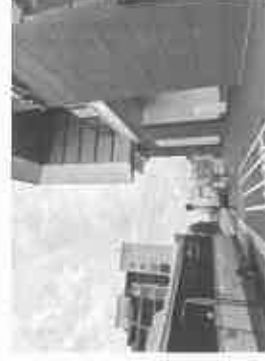
【JR 芦屋駅南側エレベーター入口】

JR 芦屋駅の駅舎外観、エスカレーターやエレベーター駅舎内などの工事は着々と進む！