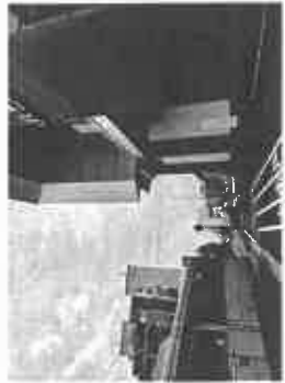
【JR 芦屋駅南側エレベーター入口】

JR 芦屋駅の駅舎外観、エスカレーターやエレベーター駅舎内などの工事は着々と進む