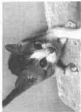
【保護猫たち、譲渡会前の一コマ】

提案②このような猫の問題を解決するには地域猫の活動を組織化して、公園などではなくシelters施設（空き家活用など）で管理すれば双方が成り立つかもしれません。