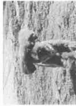
【ドッグランで走るワンちゃん】

提案③ 芦屋ストリートピアノ構想(まちかどピアノ)ですが芦屋だと言われる街かどピアノの設置を求めました