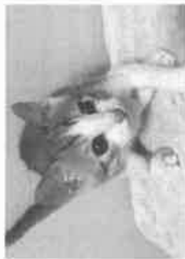
【保護猫たち、譲渡会前の一コマ】

提案② このような猫の問題を解決するには地域猫の活動を組織化して、公園などではなくシエルト施設(空き家活用など)で管理すれば双方が成り立つかもしれません。