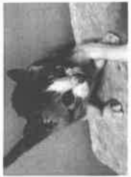
【保護猫たち、譲渡会前のココマ】

このような猫の問題を解決するには地域猫の活動を組織化して、公園などでではなくシelters施設(空き家活用など)で管理すれば双方が成り立つかもしれません。