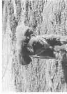
【ドッグランで走るワンちゃん】

提案③ 戸屋ストリートピアノ構想 (まちかどピアノ) さすが戸屋だと言われる街かどピアノの設置を求めました