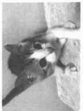
【保護猫たち、譲渡会前の〜コマ】

提案② このような猫の問題を解決するには地域猫の活動を組織化して、公園などではなくシエルトー施設(空き家活用など)で管理すれば双方が成り立ち方もいれませんか。