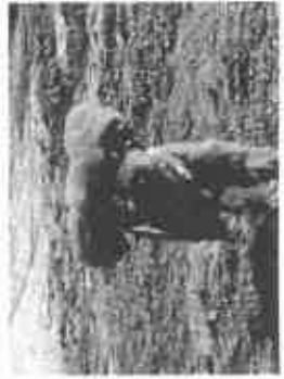
【ドッグランで走るワンちゃん】