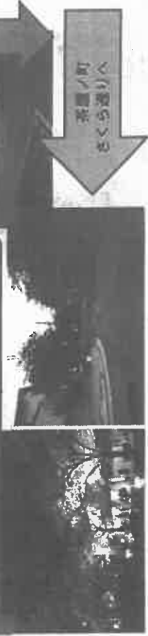
茶屋ノ町 さくら通りへ

芦屋市は令和5年・新年度の予算が 計上され実施されます。 私の提案が実現することになります