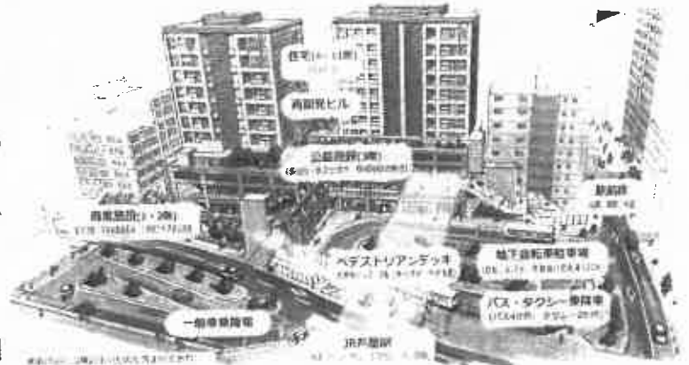
イメージ図

これから、市民の皆さまとともに、JR芦屋駅南の再開発について、一緒に考えてまいりたいと思います。