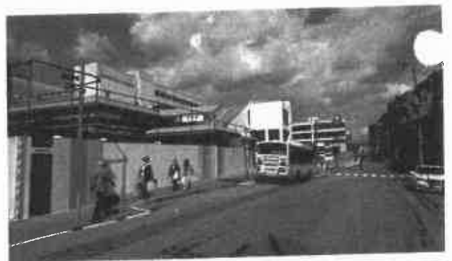
JR 芦屋駅南のようす(2020.4.2撮影)

その上で、市側からの新たな修正を加えた議案の提出を受け、その内容と事業費等を再び審議し、議会として慎重に判断してまいります。