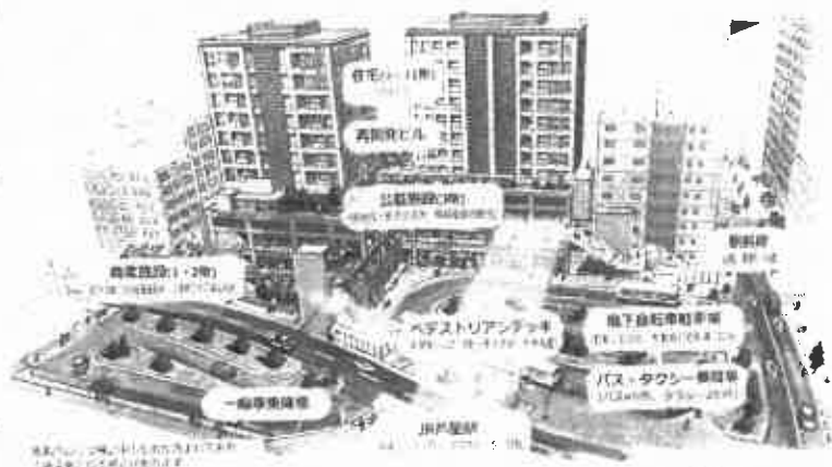
イメージ図

これから、市民の皆さまとともに、JR 芦屋駅南の再開発について、一緒に考えてまいりたいと思います。