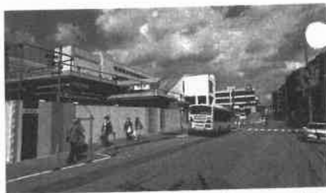
JR 芦屋駅南のようす(2020.4.2撮影)

その上で、市側からの新たな修正を加えた議案の提出を受け、その内容と事業費等を再び審議し、議会として慎重に判断してまいります。