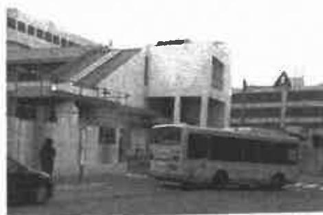
JR 芦屋駅南 2020・12・15 撮影

現行の再開発事業案を「にぎわい創出や経済の起爆剤」と位置付けながらも、具体策や効果に関して市は全く示せていません。