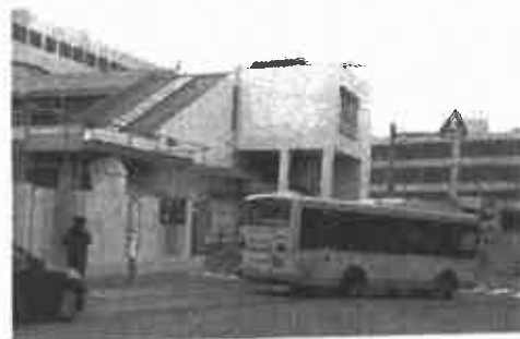
JR 芦屋駅南 2020・12・15 撮影

現行の再開発事業案を「にぎわい創出や経済の起爆剤」と位置付けながらも、具体策や効果に関して市は全く示せていません。