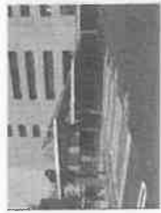
身体の不自由な方、妊婦さん、ベビーカーを使う人が優先的に利用できる駐車場

の考え方をさらに進め、障がい者、高齢者、妊婦、外国人など全ての人が暮らしやすいまちづくり、ものづくり、環境づくりを行っていくために条例