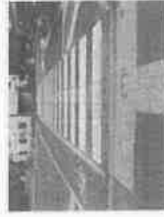
中央部分にある突起を手がかりに、目の不自由な人も横断歩道を安全に渡れます