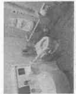
車いす、赤ちゃんづれの人、オストメイト（人口肛門保蔵者）の方も使用できる広いトイレ

の奨学金返済、仕事の非正規化、ダブルワークなど生きづらさを感じています。社会的な課題として、晩婚化、少子化、ひきこもりなどが深刻化