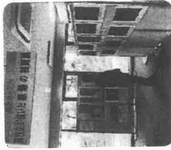
高校生が描いた原爆の絵の思いを見学し、核兵器廃絶の思いを新たにしました。