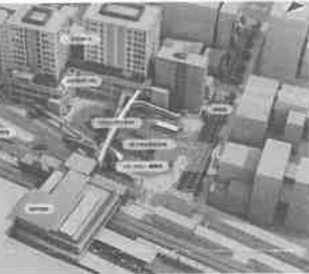
見直し後のJR芦屋南のイメージ図。 リニューアルした駅舎