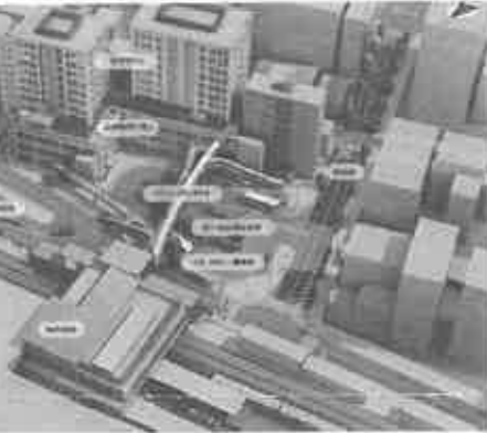
見直し後のJR芦屋南のイメージ図。 リニューアルした駅舎