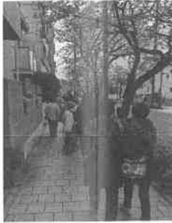
老人会のみなさんと「茶屋さくら通り」を散歩

残念ながら県の行革の中で、委託金が削られ現在は、芦屋市の一般会計と介護保険事業特別会計の予算で行われています。この事業が高齢者の方にとって大切な事業だということは市とも共通認識ですが、ここ数年で1000万円近く介護保険事業特別会計からの負担が増加しており、このままでは事業を維持できるかどうか国県への予算要望が必要です。