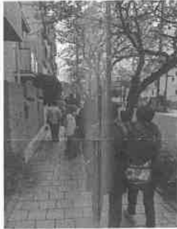
老人会のみなさんと「茶屋さくら通り」を散歩

残念ながら県の行革の中で、委託金が削られ現在は、芦屋市の一般会計と介護保険事業特別会計の予算で行われています。この事業が高齢者の方にとって大切な事業だということは市とも共通認識ですが、ここ数年で1000万円近く介護保険事業特別会計からの負担が増加しており、このままでは事業を維持できるかどうか国県への予算要望が必要です。