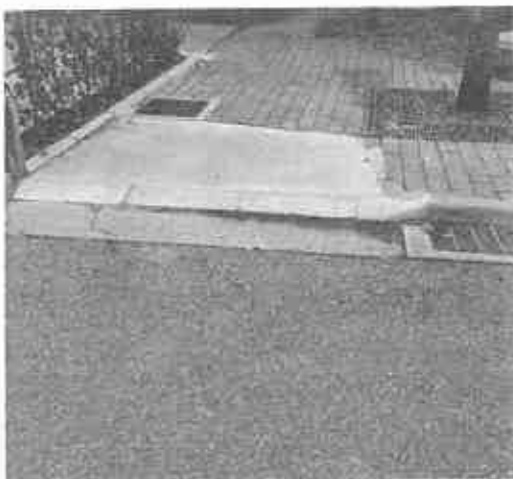
段差がなくなり安心・安全に

で対処しながら、今後高齢化が進み車いすを利用される方も増えてくるし、ベビーカーや自転車を利用する人たちにとっても