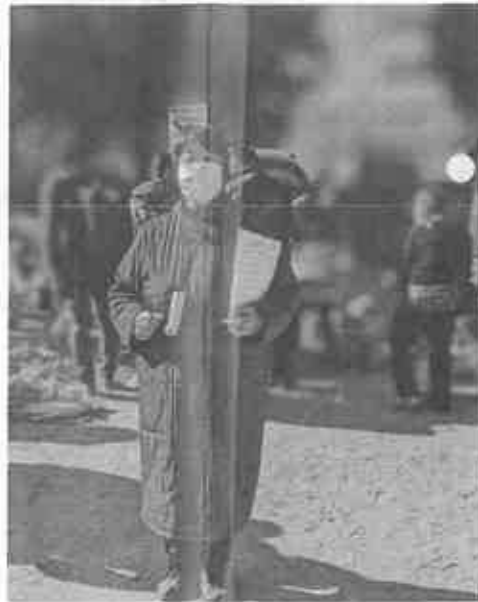
交流会には地域の方が約70人参加。 一緒に体を動かして楽しみました

12月10日に上宮川公園 で地域交流会が開催され ました。毎年恒例で行わ れる盆踊りや、おもちつ