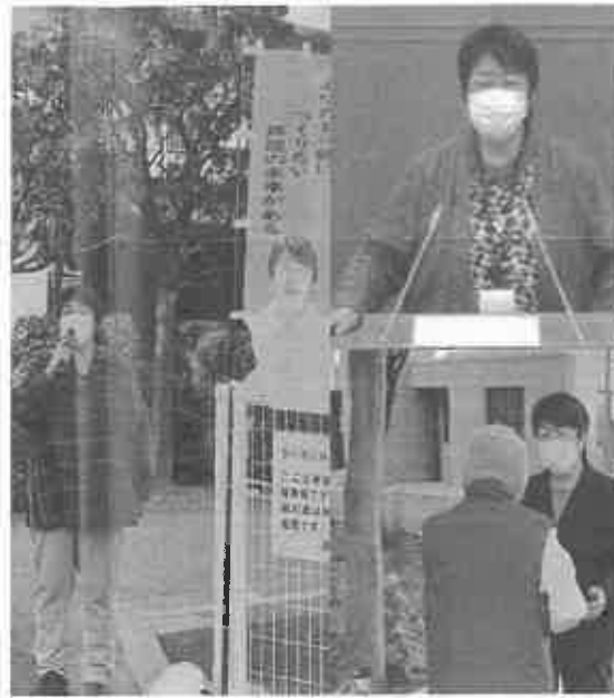
街角で市議会の報告を行っています。気軽に声をかけて下さい

子育て世帯物価高騰対策給付金支給事業や保健医療機関等物価高騰対策支援事業など4項目に関する補正予算に対して賛成の討論に立ちました。今回は育児の負担に加え、経済的負担を軽減す