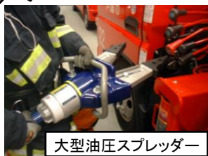
大型油圧スプレッター