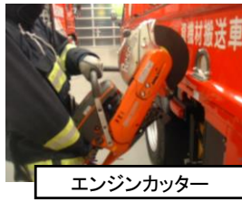
エンジンカッター