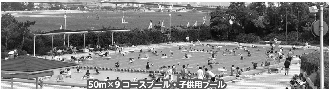
50m×9コースプール・子供用プール