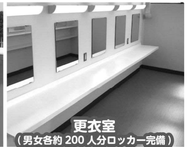
更衣室 (男女各約200人分ロッカー完備)