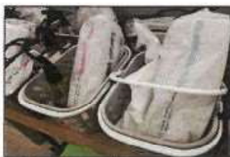
【 貸出用消毒セット 】