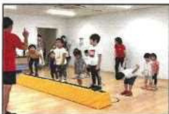
【きっかけづくり教室 (わが体操)】