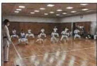
【パラスポーツデー (ユニバーサル武道・演武会)】