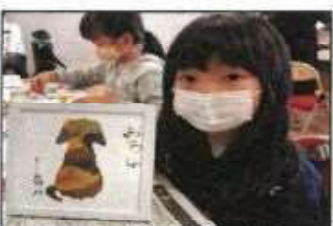
【落ち葉アート教室】