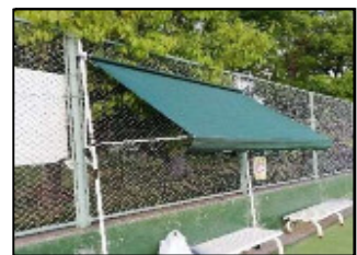
【日除け屋根の設置】