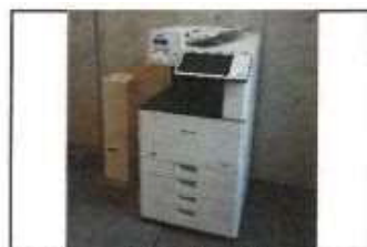
【 コピーサービス 】