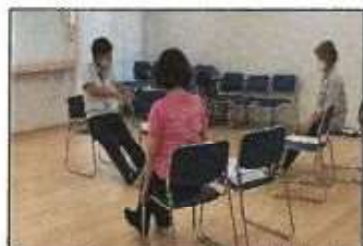
【フレイル予防教室】