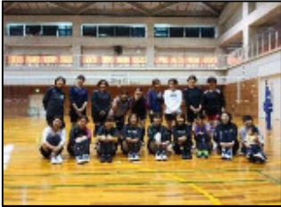
【トップアスリートイベント】