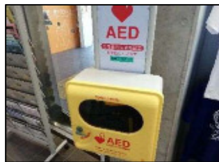
【 AEDの増設 】