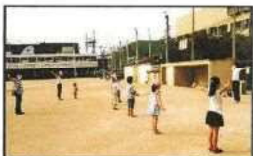
【みんなでラジオ体操】