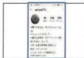
【 施設公式Instagram 】