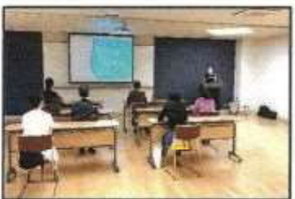
【スポーツ栄養講座】