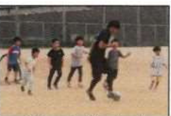
【ジュニアサッカー】