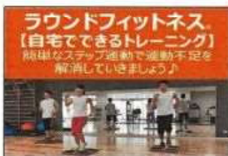
【 HP配信動画① 】