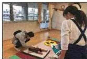
【お昼寝アート撮影会】