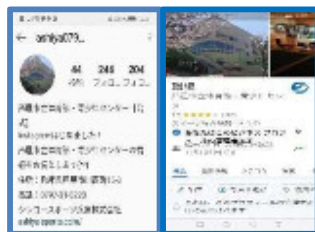
【 SNSの活用 】