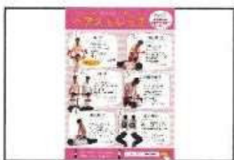
【 運動パンフレット 】