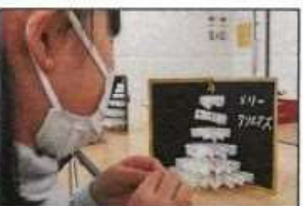
【手作りクリスマスカード】