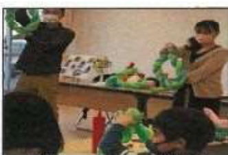
【バルーンアート教室】