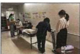
【体力測定会 (インボディ測定会)】