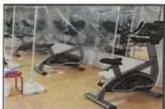
【 エアロバイク3台の新規設置 】