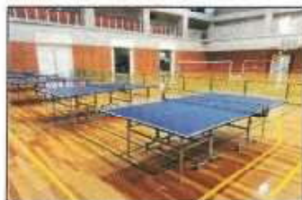
【 卓球台9台の入替 】