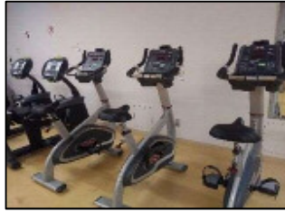
【アップライトバイク】