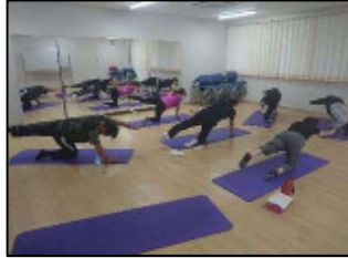
【 ヨガ教室 】