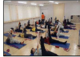
【背骨コンディショニング教室】