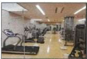
【 トレ室飛沫防止シート 】