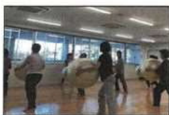
【生活筋力向上教室】