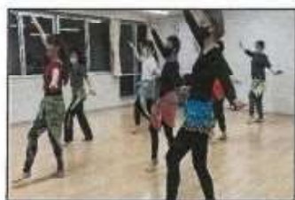
【ベリーダンス教室】