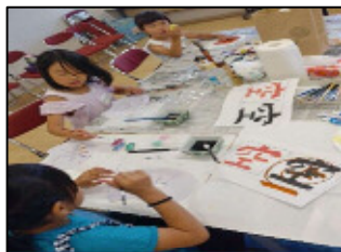
【夏休み宿題応援隊】