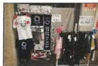
【 オリンピックグッズ販売 】