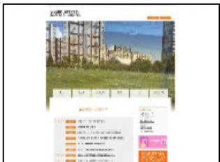
【施設ホームページ】