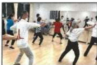
【きっかけづくり教室 (太極拳)】