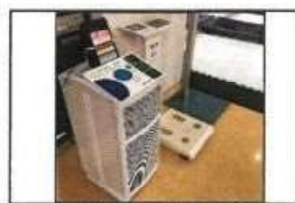
【 空間除菌清浄機 】