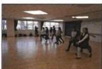
【きっかけづくり教室 (姿勢改善)】