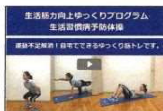
【 HP配信動画② 】