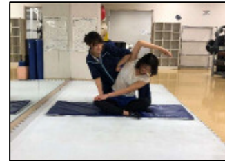
【パーソナルストレッチ】