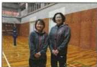
【 トップアスリートイベント (バレーボールクリニック) 】