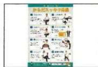
【 運動パンフレット 】