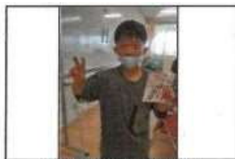
【夏休み宿題応援隊】