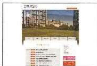
【 施設公式ホームページ 】