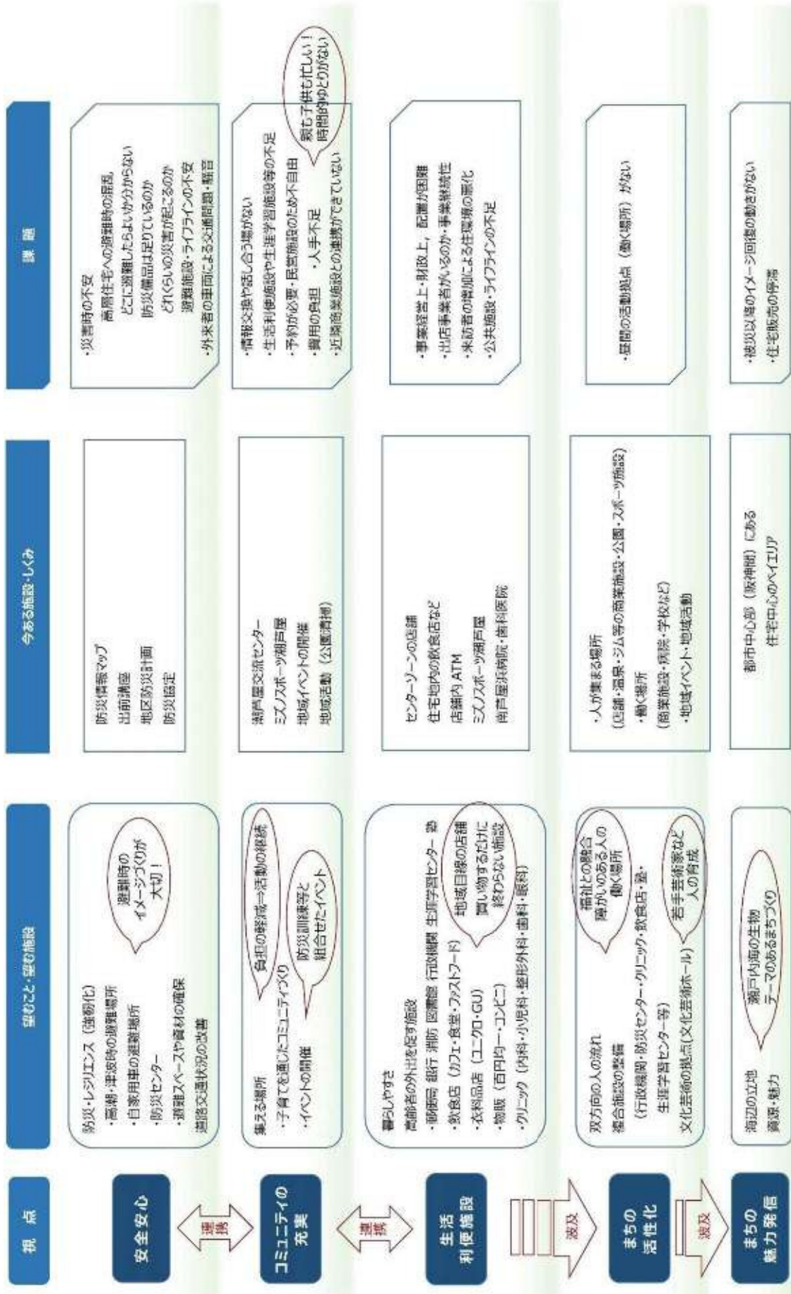
図 1 意見交換のまとめ