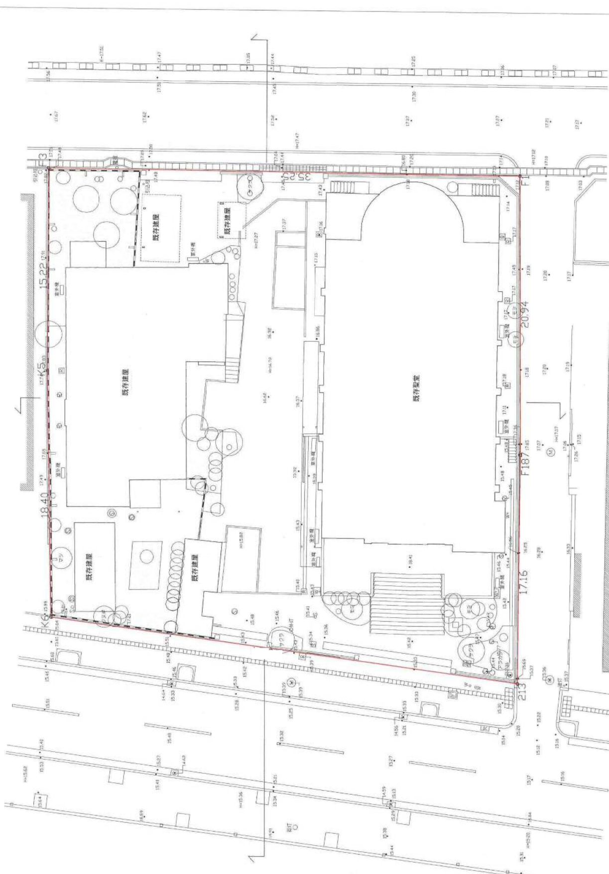
現況平面図断面図