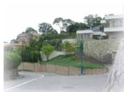
緑あふれる住宅地

の病院などが並び、芦屋らしい風情を感じさせる趣があります。また、東芦屋町の芦屋神社などは歴史的景観要素を有しています。これらの地区をネットワークし、歴史豊かな街並みを生かした散策空間の整備を検討します。特に、芦屋川駅前商店街については、個性的で親しみのあるにぎわい空間の形成のため、山手線の整備に併せて歩行者優先道路化を検討します。