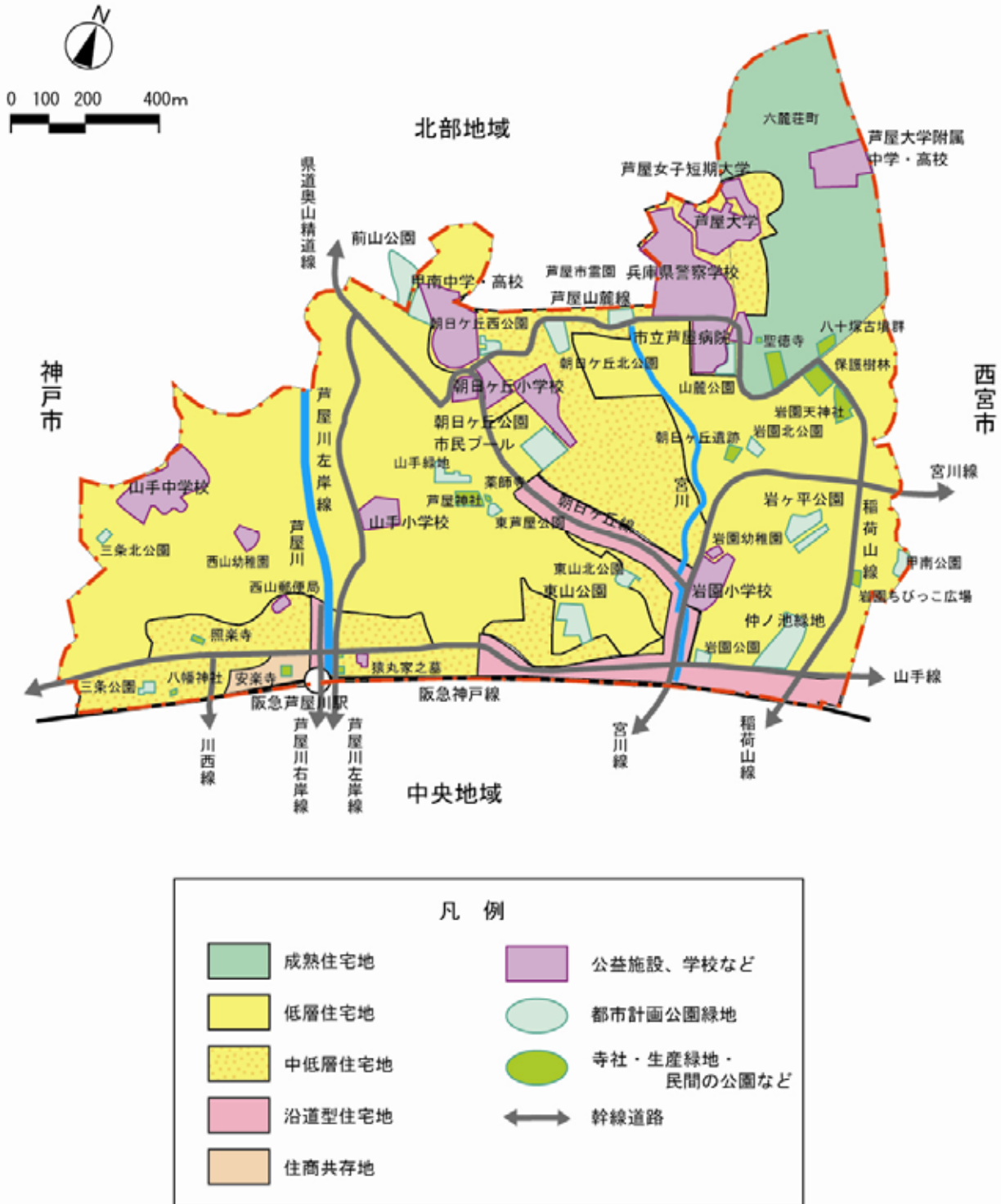
図 3-2 山手地域の土地利用方針