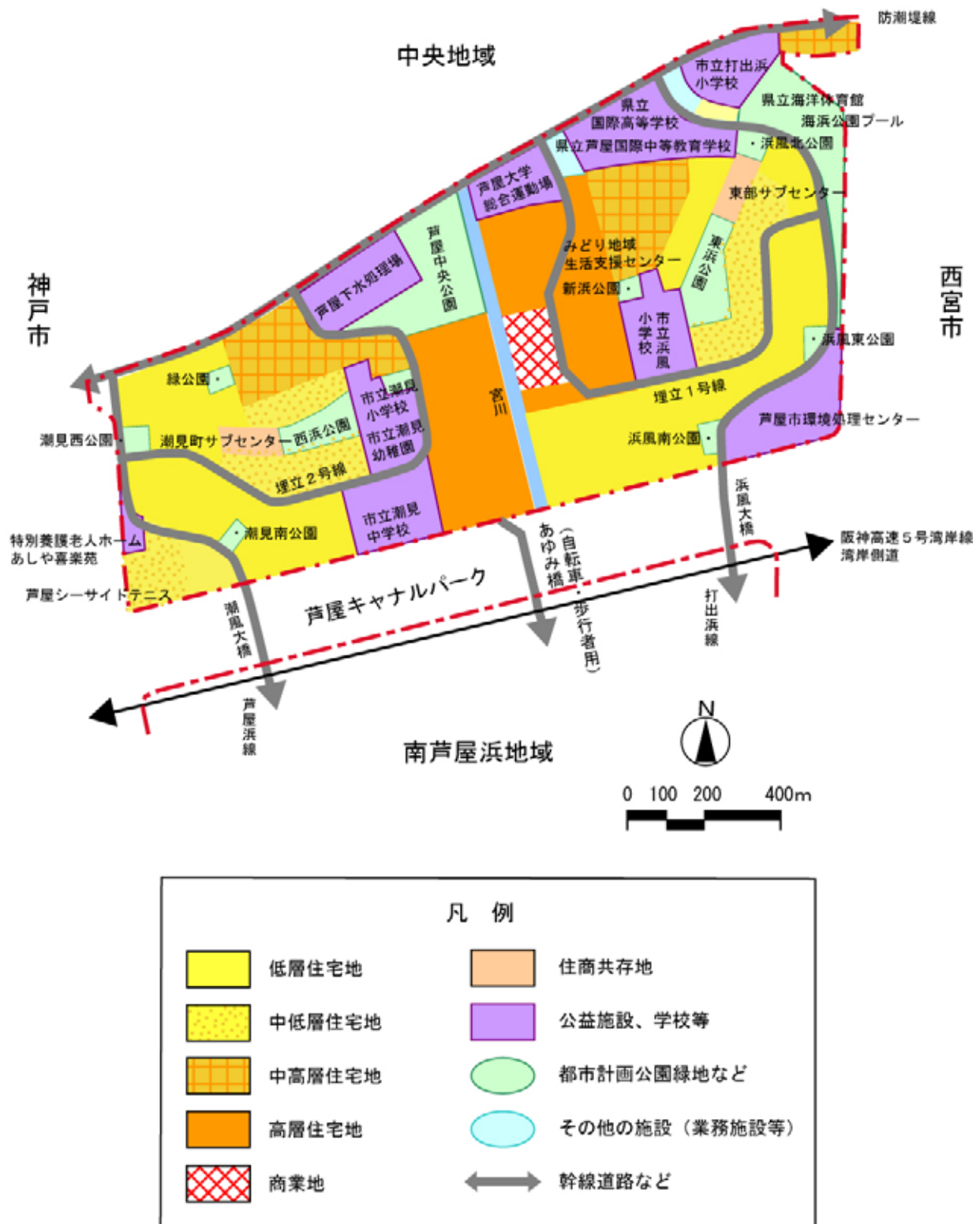
図 5-2 浜地域の土地利用方針