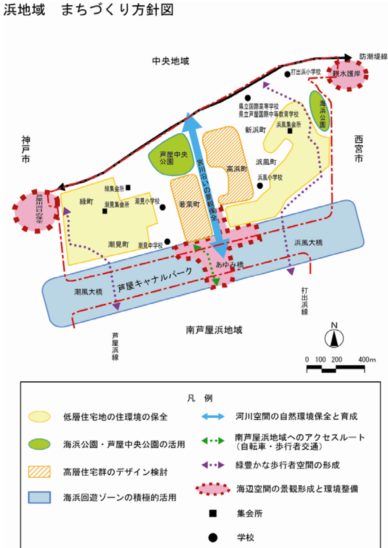
図 5-3 浜地域のまちづくり方針