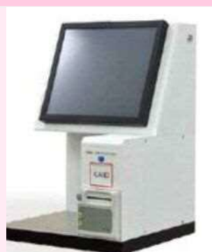
卓上型自動貸出機

令和6年4月から自動貸出機、セキュリティゲート、予約本受取コーナー（本館）の利用が開始できるように、令和5年度中に図書館の蔵書すべてに I C タグを貼り付けます。 自動貸出機や予約本受取コーナーの導入により、利用者の待ち時間短縮やプライバシーの更なる確保を実現します。 また、蔵書点検を効率的に行うことで休館日を減らすことができ、市民の利便性を高めます。