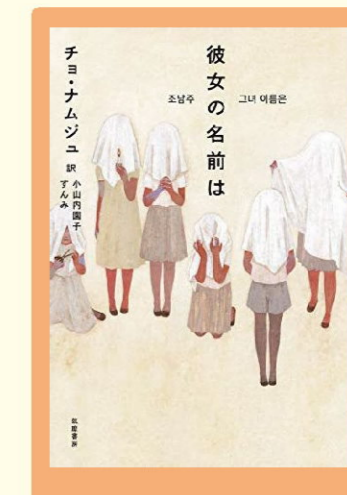
チヨ ナムジュ（著） 筑摩書房

お隣の国で起こっていることとは思えないほど、特に女性は身近に感じられる問題を取り上げた短編小説です。闇の先に見える光と彼女たちの勇気に胸を打たれます。