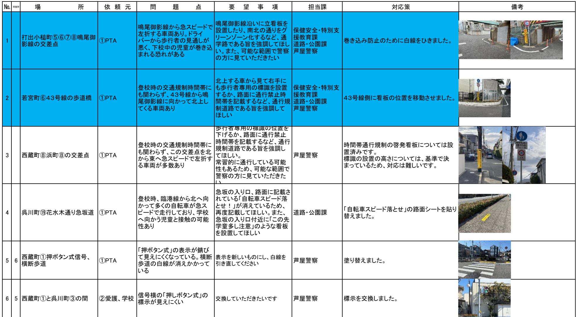
【芦屋市立宮川小学校 通学路の点検箇所 一覧表】(令和5年6月実施・令和6年2月確認)