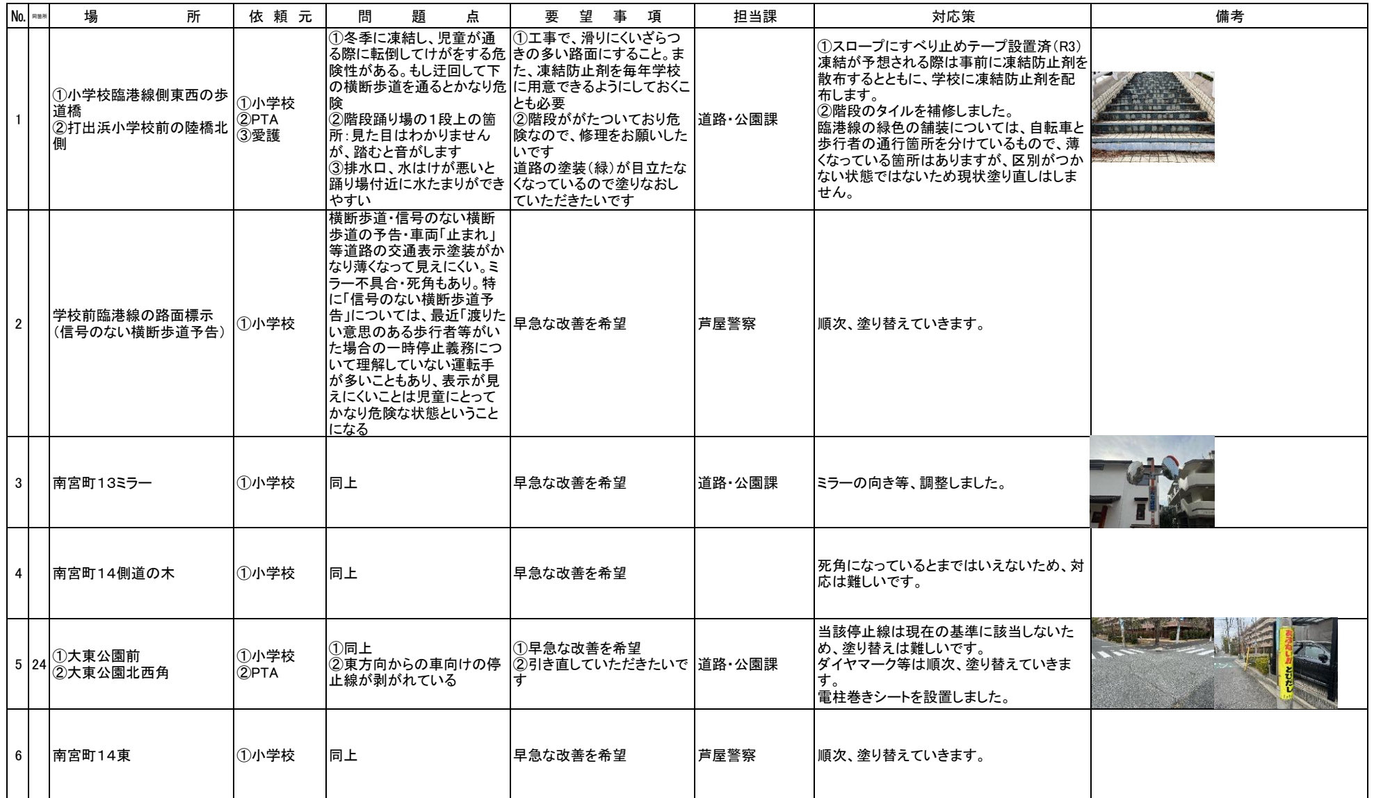
【芦屋市立打出浜小学校 通学路の点検箇所 一覧表】(令和5年6月実施・令和6年2月確認)