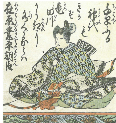
在原業平（825 - 880年） 『若鶴百人一首』（芦屋市立美術博物館蔵）

在原業平は平城天皇の孫であり、家柄は大変良く、容姿も美男子であったと言われ、伊勢物語』では数多くの女性と関係したモテぶりが描かれ、ときには、結ばれることが許されない立場の女性と禁断の恋におちてしまうなど、大胆な行動をとる一面を持ち合わせています。一方で歌の才能は、六歌仙・三十六歌仙として平安時代を代表する歌人として大変優れているのですから、さながら平安時代のアイドルと言える人物です。 今に残る業平にゆかりある伝説 芦屋市には、「業平町」という在原業平の名がつけられたまちがあります。業平町の名称は、大正時代に架けられた「業平橋」に由来し、1944年（昭和19年）の町名改正で誕生しました。また、芦屋市には業平の父親である阿保親王のお墓だと言われ、阿保親王のお墓ではありません。阿保親王塚古墳の出土品から、阿保親王の没年より約500年も古い4世紀代（古墳時代前期）に造られた古墳であることが明らかとなっています。 この他にも、市内には阿保親王の住地に建立されたと伝えられる親王寺が打出町にあるなど、業平の父、阿保親王にゆかりある伝説も残っています。