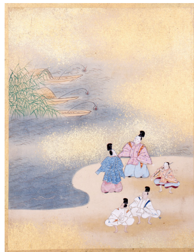
『伊勢物語』第87段 芦屋の灘の漁火 『伊勢物語画帖』画：狩野探雪（芦屋市立美術博物館蔵）