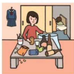
アルコール・薬物・ギャンブル問題を抱える家族に対応している