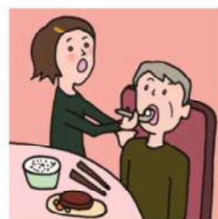
障がいや病気のある家族の身の回りの世話をしている