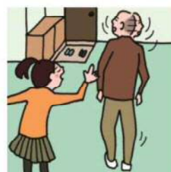
目を離せない家族の見守りや声かけなどの気づかいはしている