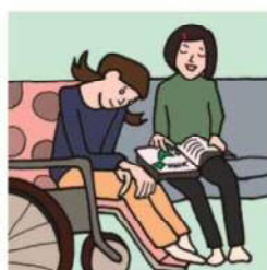
障がいや病気のあるきょうだいの世話や見守りをしている