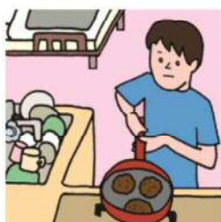
障がいや病気のある家族に代わり、買い物・料理・掃除・洗濯などの家事をしている

家族にケアを要する人がいる場合に、大人が担うようなケア責任を引き受け、家事や家族の世話、介護、感情面のサポートなどを行っている18歳未満の子どものことをいいます。