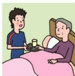
がん・難病・精神疾患など慢性的な病気の家族の看病をしている