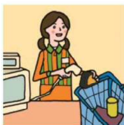
家計を支えるために労働をして、障がいや病気のある家族を助けている