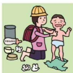
家族に代わり、幼いきょうだいの世話をしている