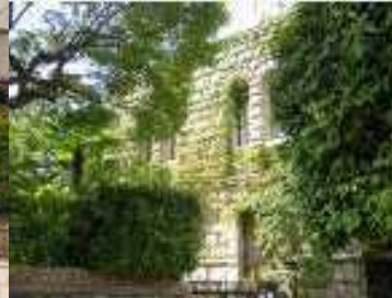
打出教育文化センター