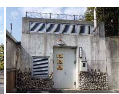
山手幹線ポンプ棟