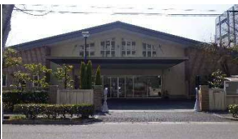
みどり地域生活支援センター