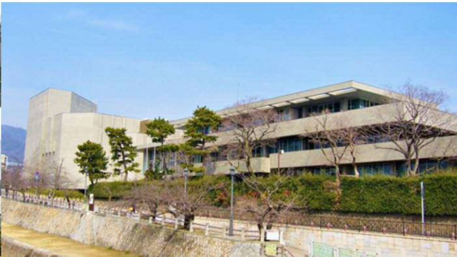
芦屋市民センター