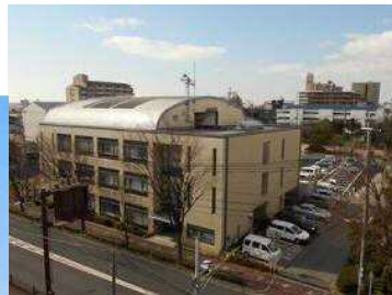
上宮川文化センター