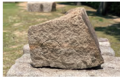
美術博物館前庭の刻印石

約400年前の「刻印石」に彫られた大名のマークを紙に写しとる拓本を楽しみながら、徳川大坂城東六甲採石場について学びます。