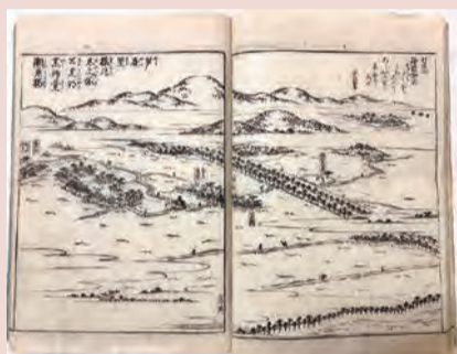
「摂津名所図会 芦屋」

古代から現代まで、洗練された歴史・美術・文学が育まれた芦屋について、各専門分野の学芸員が紹介します。