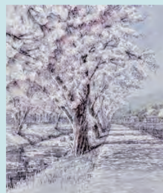
「黒川の桜路」天野隆生作

旅先で沢山の美しい風景に出会う、それは描かずにはいられない感動と至福の瞬間です。