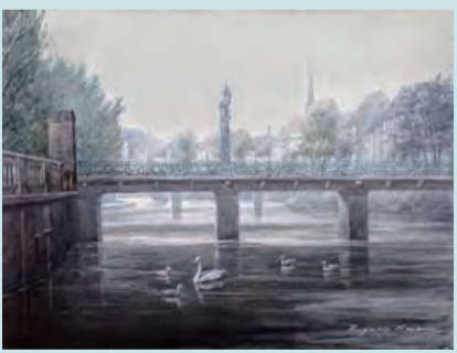
「イル川に架かる橋」天野隆生作