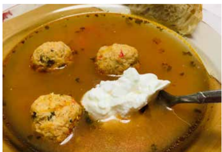
チョルバデペリショアレ