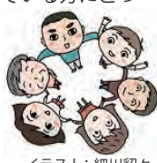
イラスト: 細川 夕々