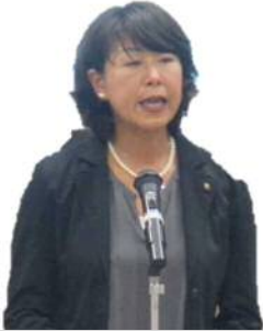
市長 いたう まい

平成29年度から「未来へ向けた成長戦略型」の行政改革を5か年計画で進めており、人口減少・少子高齢化に起因する様々な課題の解決を中心にすえ、本市が、より魅力あるまちとなるよう取組を展開しているところです。